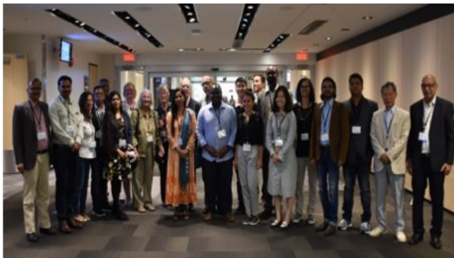
Meeting with IGU President Yukio Himiyama

III. IGU-YECG Paper Sessions 1 and 2 – The other main activities at the conference were the two oversubscribed paper sessions. The first one took place on the August 8th from 10h30 to 12h00, and the second (August 9th) from 15h30 to 17h00. Each of the paper sessions had five